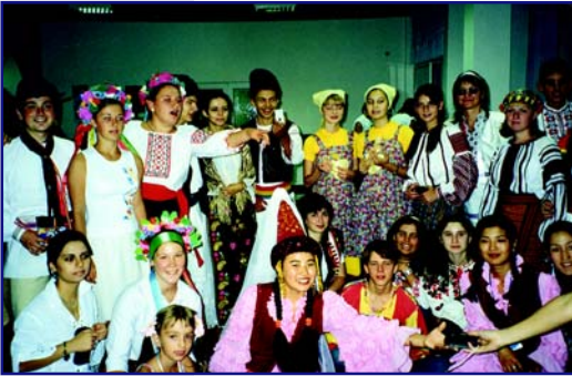
Свято національностей — у колі друзів

В наш час бурхливо розвивається молодіжний рух в усіх країнах світу. Нині молодь цікавиться такими серйозними проблемами, як проблеми збереження водного фонду світу, забезпечення життя нормальними санітарно-гігієнічними умовами. Саме ці питання й обговорювалися під час 4-ого Європейського Молодіжного Водного Парламенту.