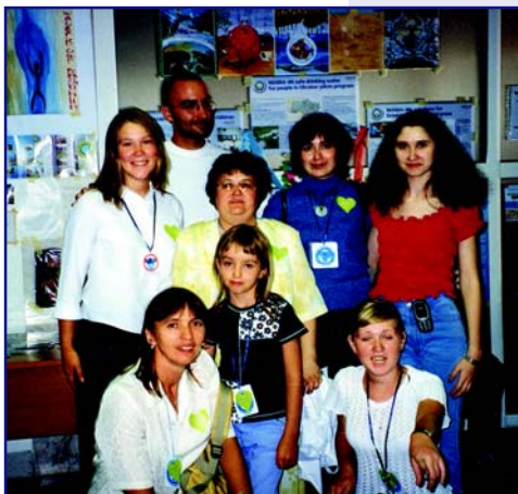
Делегація ВЕГО «МАМА-86»

У день відкриття 4-ого Європейського Молодіжного Водного Парламенту було урочисто проголошено та нагороджено найактивніших учасників та переможців конкурсів.