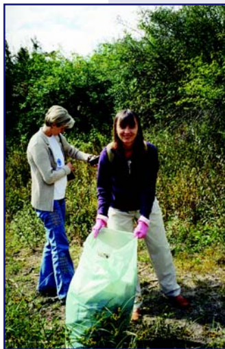
Акція з прибирання сміття біля озера

Під час роботи парламенту всі парламентарії мали змогу поділитися своїм досвідом роботи щодо вирішення водних проблем. Та для молоді не останню роль відігравало те, що вони мали змогу поспілкуватись з ровесниками з інших країн Європи. Важливим результатом цієї поїздки, для мене особисто можна вважати те, що тепер я вчуся на курсах англійської мови. Мій проект впроваджується в життя, а я вже думаю над новими напрямками роботи щодо проблем води, санітарії та гігієни. Та найголовніше — те, що «відвідавши те життя», я знаю, чого я хочу досягнути. І бажаю кожному відчути смак «життя в іншому світі» та досягнути успіху на шляху піднесення рівня життя в нашій країні.