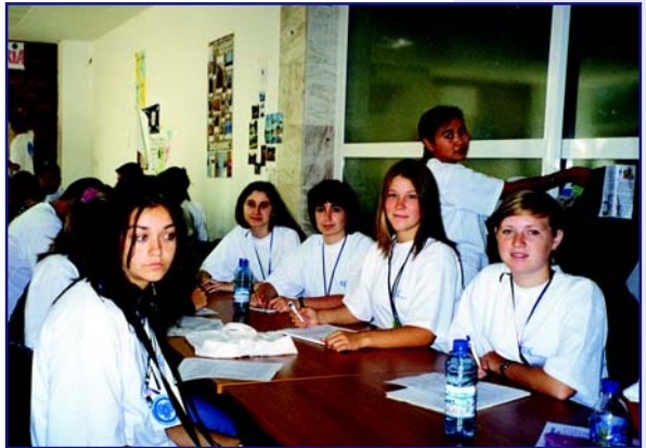
Молоді парламентарії — волонтери ВЕГО «МАМА-86»

1. Підвищити обізнаність громадськості щодо питань водного управління шляхом ініціювання та проведення різноманітних заходів та дій: фестивалів Води, мирних демонстрацій та парадів; видання брошур, плакатів та проведення кампаній у ЗМІ. Цілями цієї діяльності буде посилення просвітньої роботи, сприяння зміні