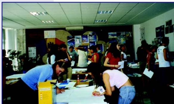
Підготовка плакатних презентацій водних проектів молоді

відносин та залученню до практичних дій громадян, особливо школярів, щодо вирішення проблем охорони водних об'єктів та раціонального водоспоживання;