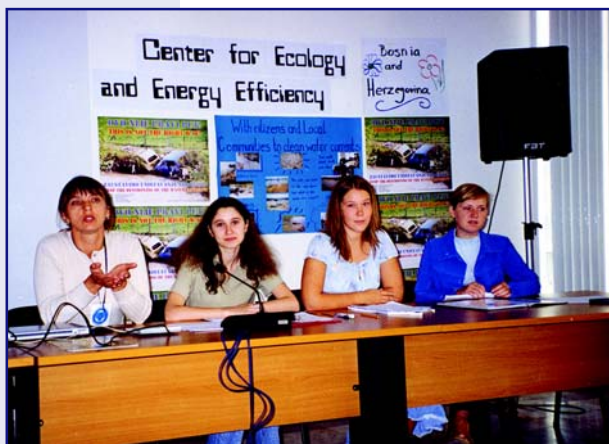
Презентація роботи кампанії «Чистотіл» на пленарному засіданні

Робота Парламенту складалася з пленарних сесій та засідань робочих груп, на яких готувалися офіційні документи, програма Водного Фестивалю;